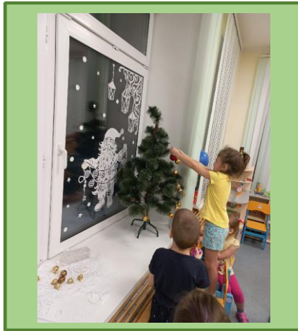
Украшение искусственной ёлки в группе