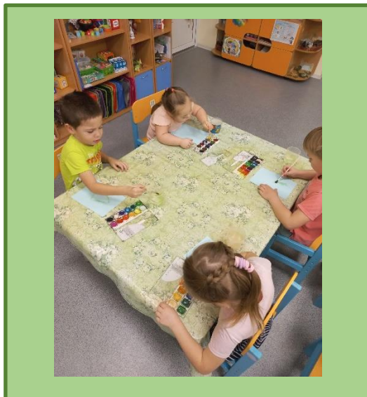
Рисование «Зелёная красавица»