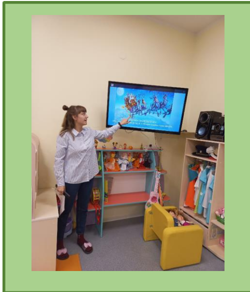
Проведение бесед по теме проекта